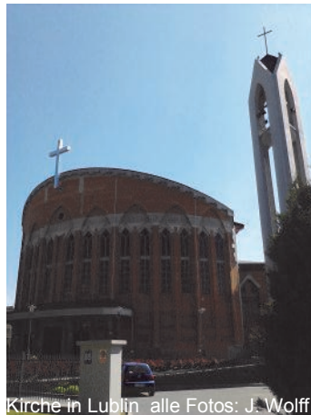
Kirche in Lublin

Als ich im Mai mit einem polnischen Priesterfreund durch Südost-Polen gefahren bin, ist mir aufgefallen: viele neue und schöne Kirchen! In der Vergangenheit gab es nur in größeren Dörfern und Städten eine Kirche. Nach dem Ende der kommunistischen Unterdrückung der Religionsausübung sind Kirchen gebaut worden als Zeichen für die neugewonnene Freiheit.