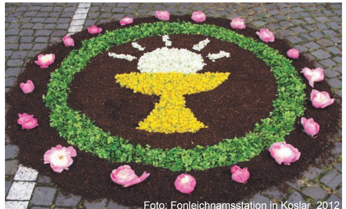
Foto: Fronleichnamstation in Koslar 2012

Der Seelsorgebereich Nord-Ost feiert mit vier Gemeinden die Hl. Messe in Serrest nach Prozessionen dorthin - während sich die Gemeinden aus Barmen und Broich auf einem Bauernhof in Broich zur Festmesse mit anschließender Prozession treffen.